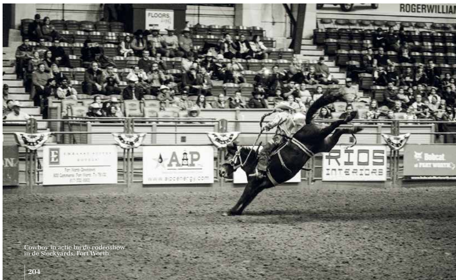
Cowboy in actie bij de rodeoshow in de Stockyards, Fort Worth.