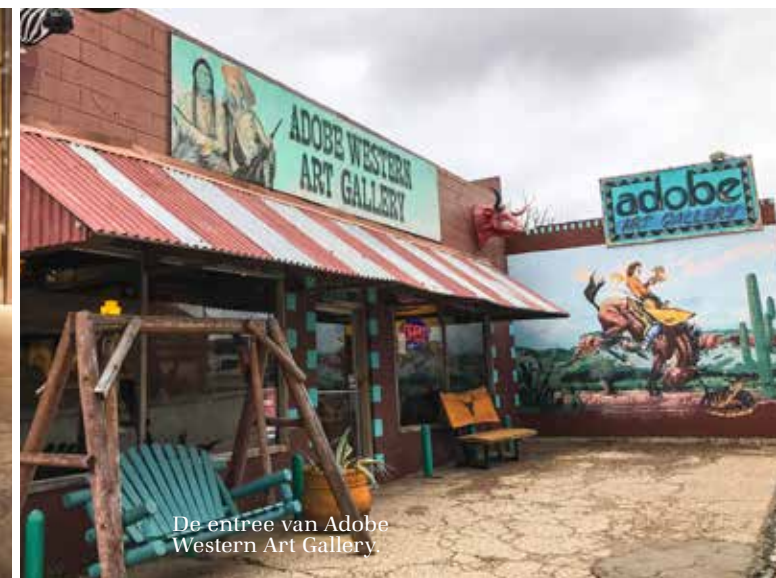
De entree van Adobe Western Art Gallery.