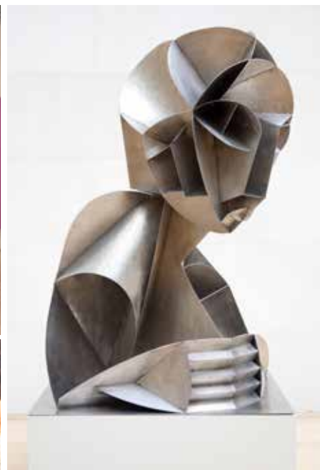
Kloksgewijs Kunstwerk Bozo the Clown Runs for President in het Nasher Sculpture Center in Dallas; daar vind je ook Constructed Head No. 2 van Naum Gabo; bijzondere glas-inloodramen in Rosewood Mansion on Turtle Creek, Dallas; suite in Rosewood Mansion.