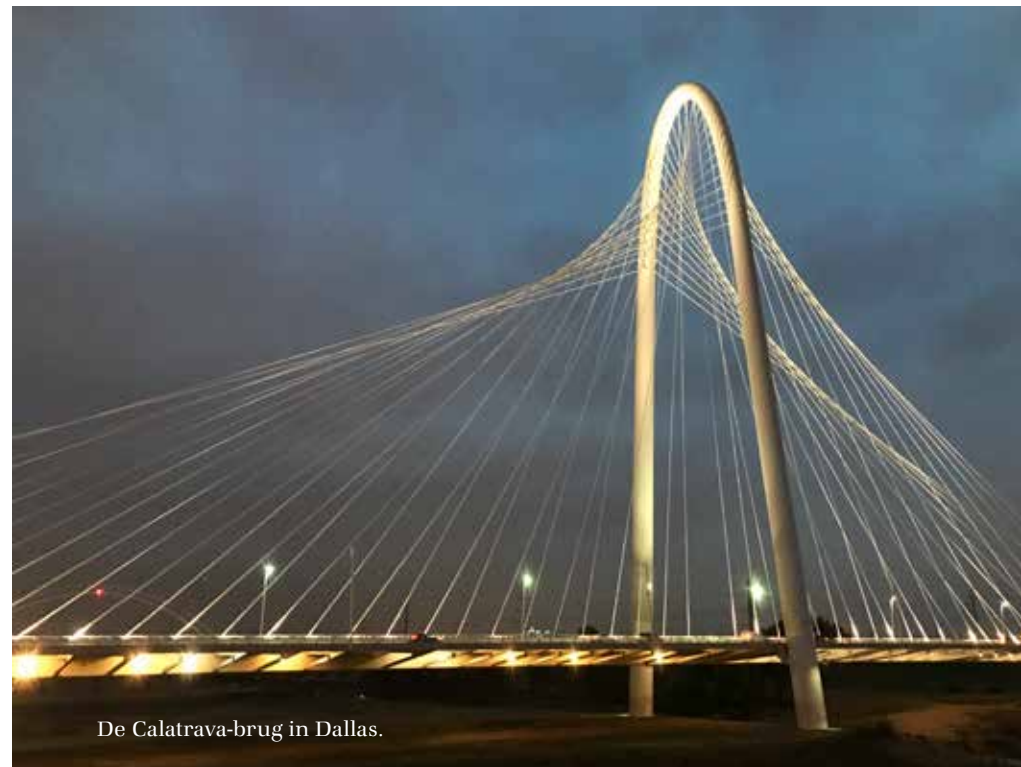
De Calatrava-brug in Dallas.