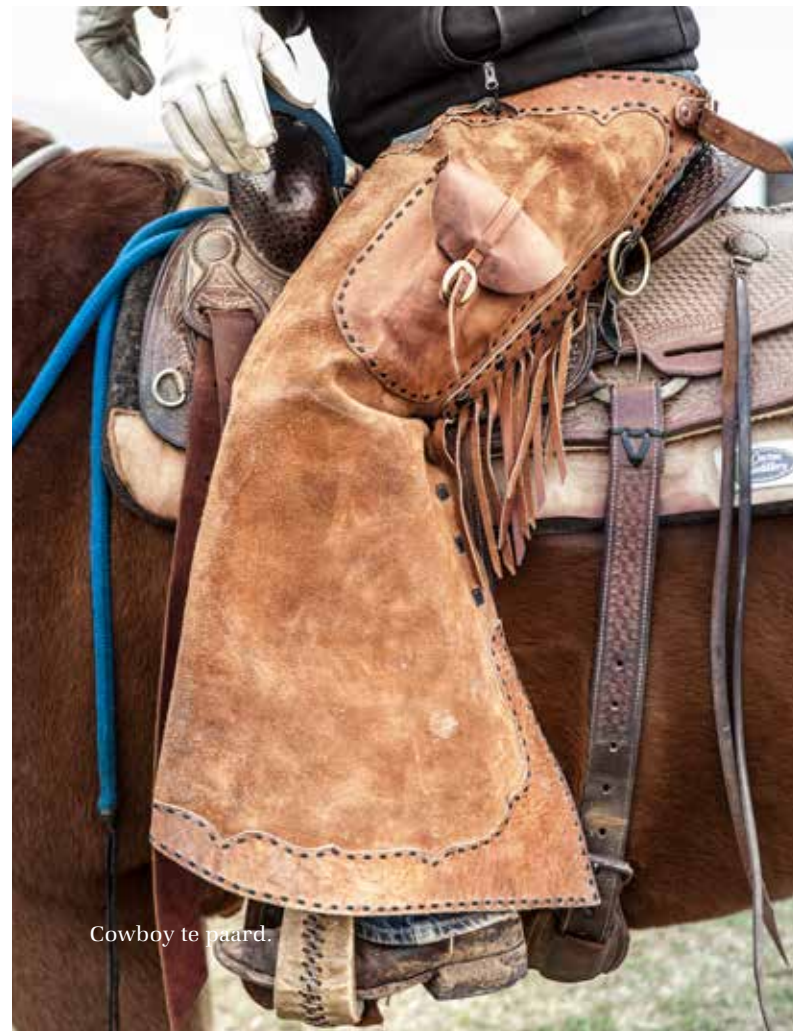
Cowboy te paard.

Een fenomeen in het Stockyardsdistrict is de Cattle Drive. Elke ochtend drijven cowboys te paard een kudde Texas Longhorns door de straten van Fort Worth (bijgenaamd Cowntown) om ze te laten grazen in de wei. De dieren hebben extreem brede hoorns en stammen