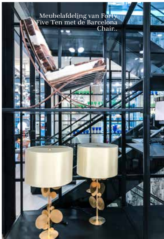
Meubelafdeling van Forty Five Ten met de Barcelona Chair.