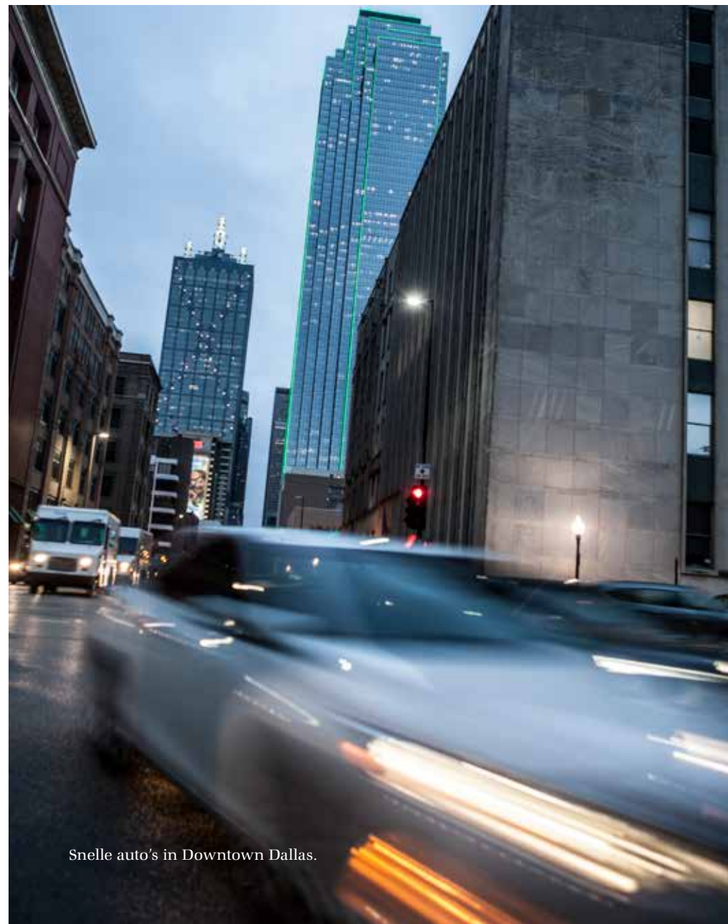
Snelle auto's in Downtown Dallas.