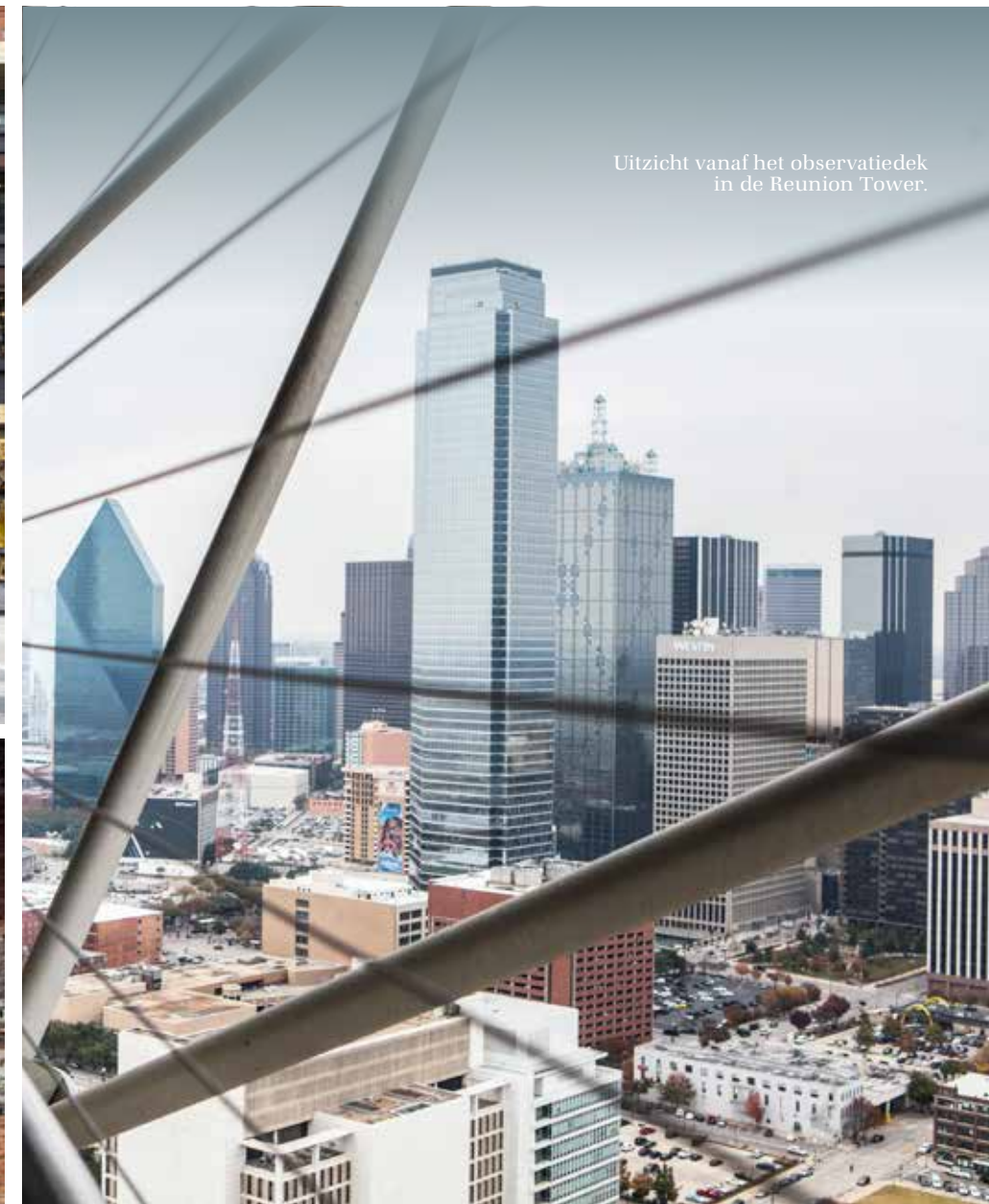
Uitzicht vanaf het observatiedek in de Reunion Tower.