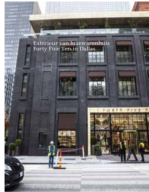
Exterieur van luxewarenhuis Forty Five Ten in Dallas.