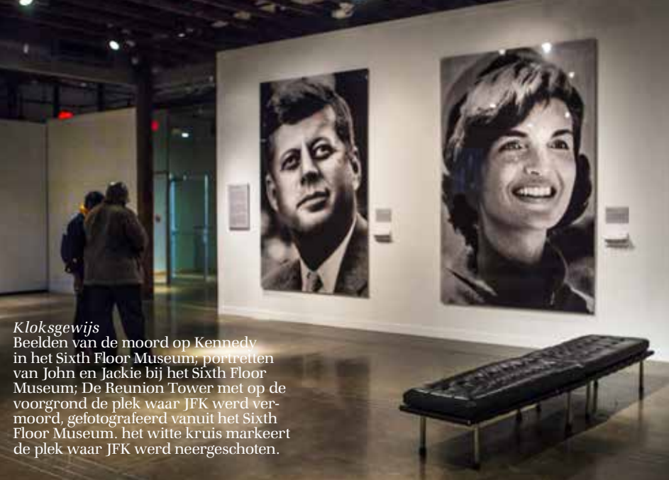
Kloksgewijs Beelden van de moord op Kennedy in het Sixth Floor Museum; portretten van John en Jackie bij het Sixth Floor Museum; De Reunion Tower met op de voorgrond de plek waar JFK werd vermoord, gefotografeerd vanuit het Sixth Floor Museum, het witte kruis markeert de plek waar JFK werd neergeschoten.

De limousine met JFK en Jackie was net de hoek omgekomen vanuit Houston Street naar Elm Street ter hoogte van Dealey Plaza. De zon scheen en de wagen reed zonder overkapping. Dan klinken schoten... Witte kruisjes op de weg markeren de plek waar het eerste en waar het fatale schot viel