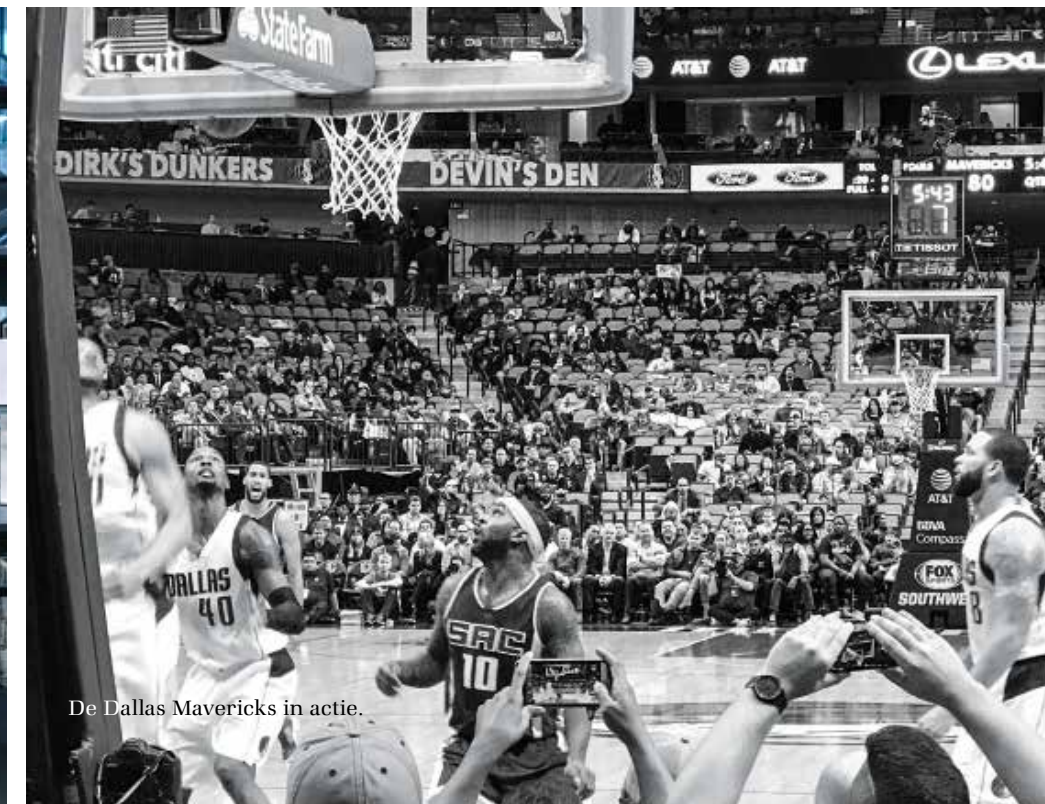
De Dallas Mavericks in actie.