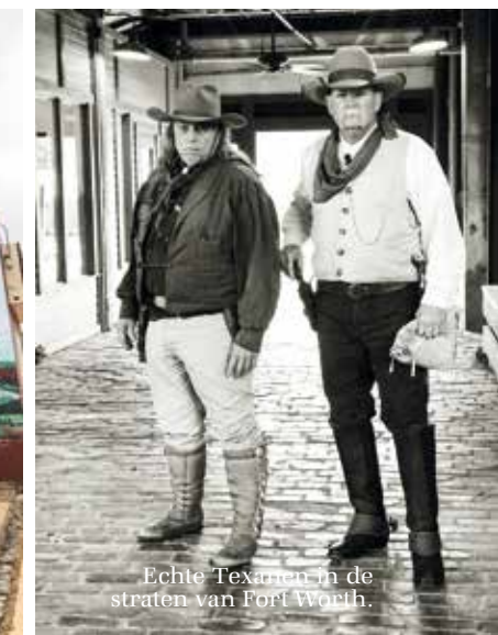
Echte Texanen in de straten van Fort Worth.