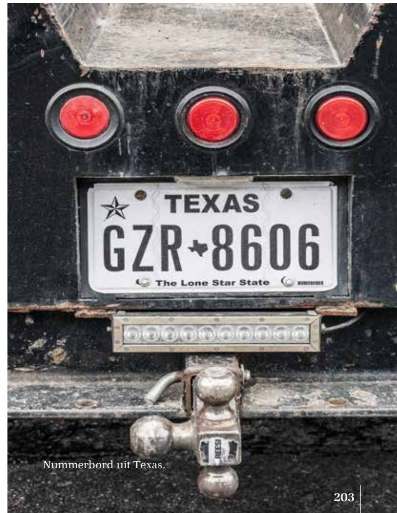
Nummerbord uit Texas.