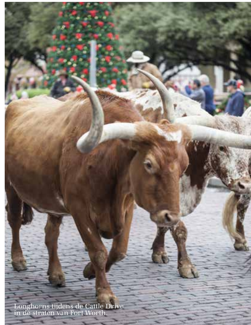
Longhorns tijdens de Cattle Drive in de straten van Fort Worth.