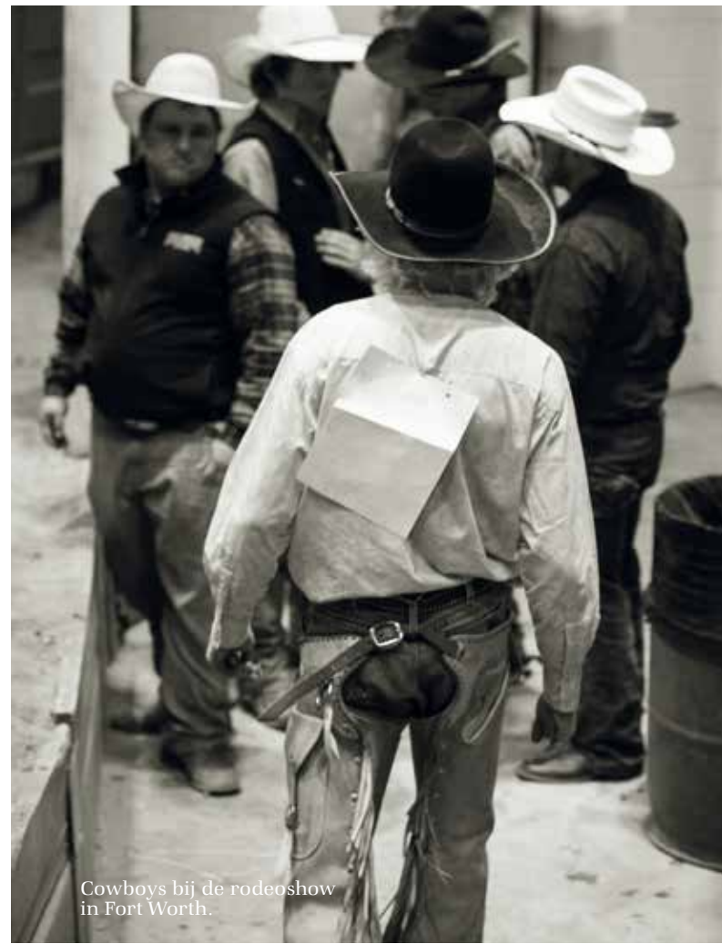
Cowboys bij de rodeo show in Fort Worth.