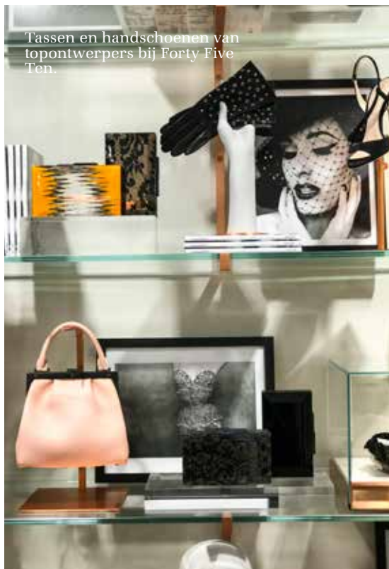
Tassen en handschoenen van topontwerpers bij Forty Five Ten.