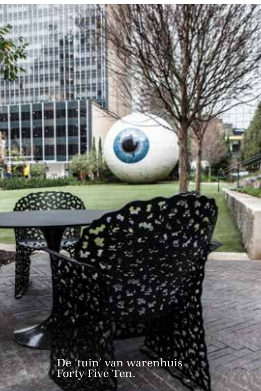
De 'tuin' van warenhuis Forty Five Ten.