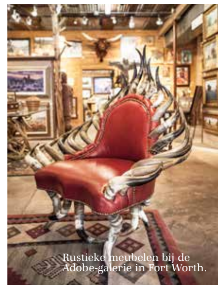
Rustieke meubelen bij de Adobe-galerie in Fort Worth.

Elke ochtend drijven cowboys te paard een kudde Texas Longhorns door de straten van Fort Worth (bijgenaamd Cowtown) om ze te laten grazen in de wei. De dieren hebben extreem brede hoorns en stammen rechtstreeks af van de runderen die de Spaanse kolonisten meebrachten. In vaste formatie trekt de stoet cowboys en vee langs het toegestroomde publiek