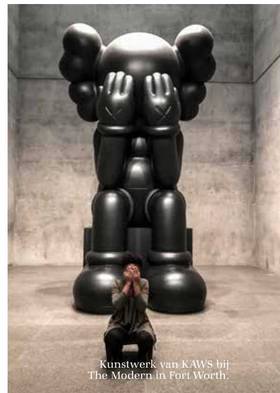
Kunstwerk van KAWS bij The Modern in Fort Worth.

Hoogtepunt is het vorig jaar geopende warenhuis Forty Five Ten, eveneens aan Main Street, een onwaarschijnlijk stijlvol en modern warenhuis. Big Things Happen Here is de slogan van Dallas