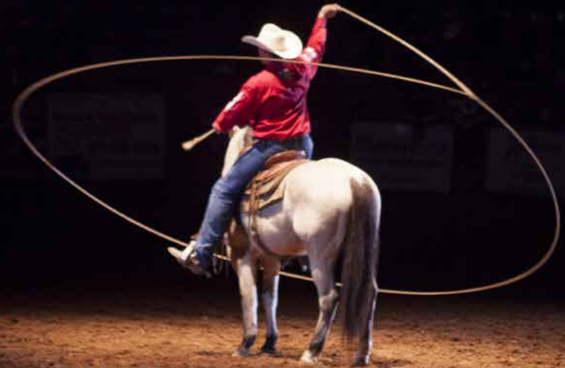
Rodeoshow in het Coliseum, Fort Worth.

TEKST HARMKE KRAAK | FOTOGRAFIE ESTHER QUELLE MET DANK AAN WWW.ALAMO.NL