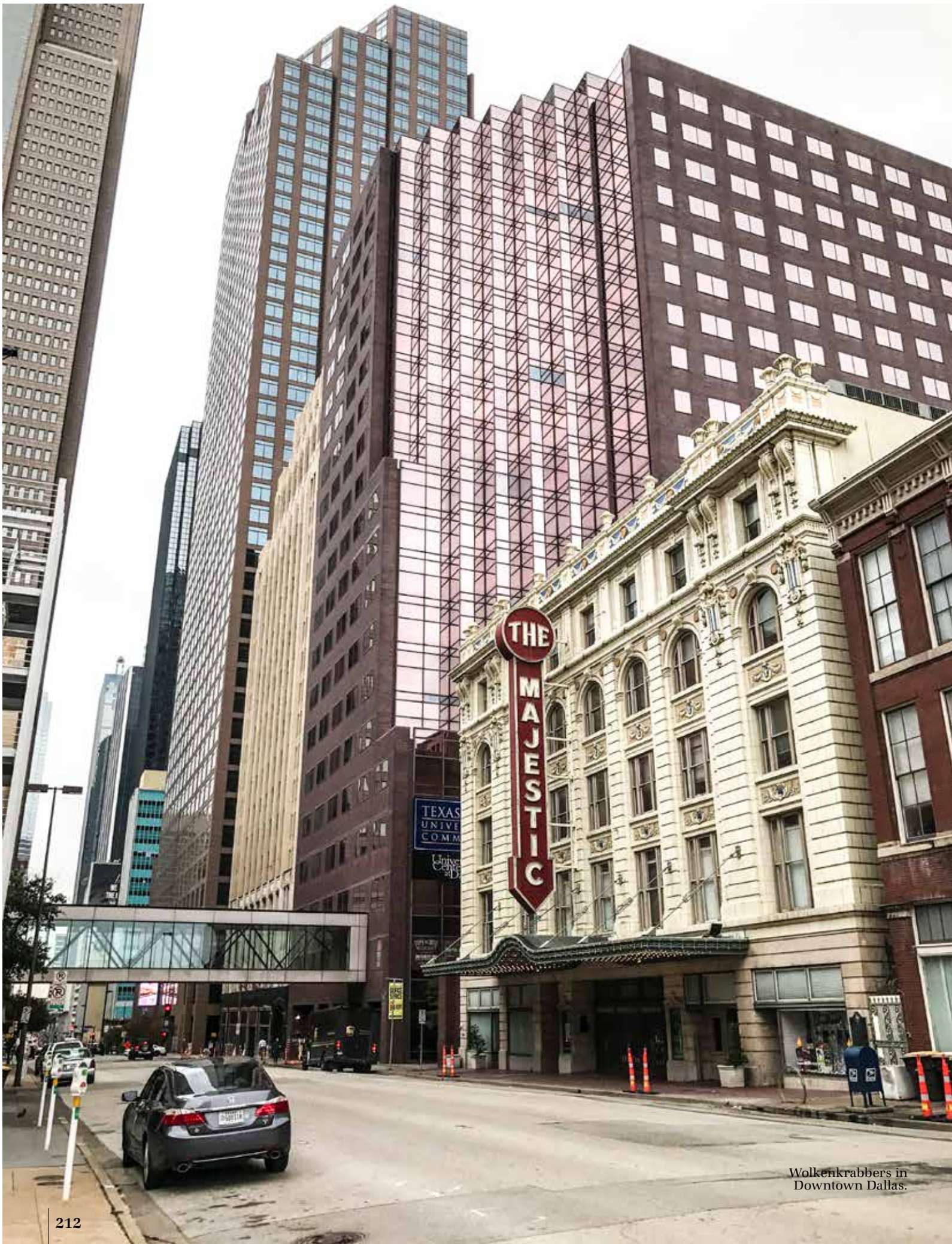
Wolkenkrabbers in Downtown Dallas.