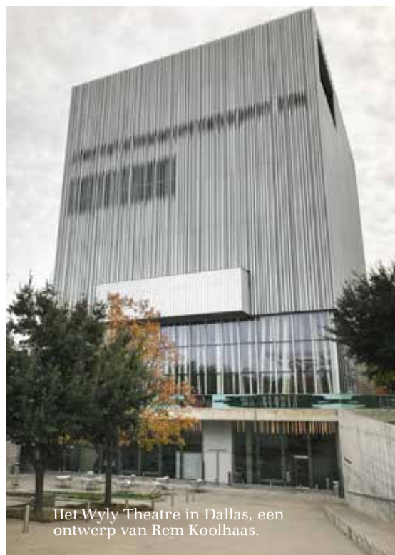
Het Wylly Theatre in Dallas, een ontwerp van Rem Koolhaas.