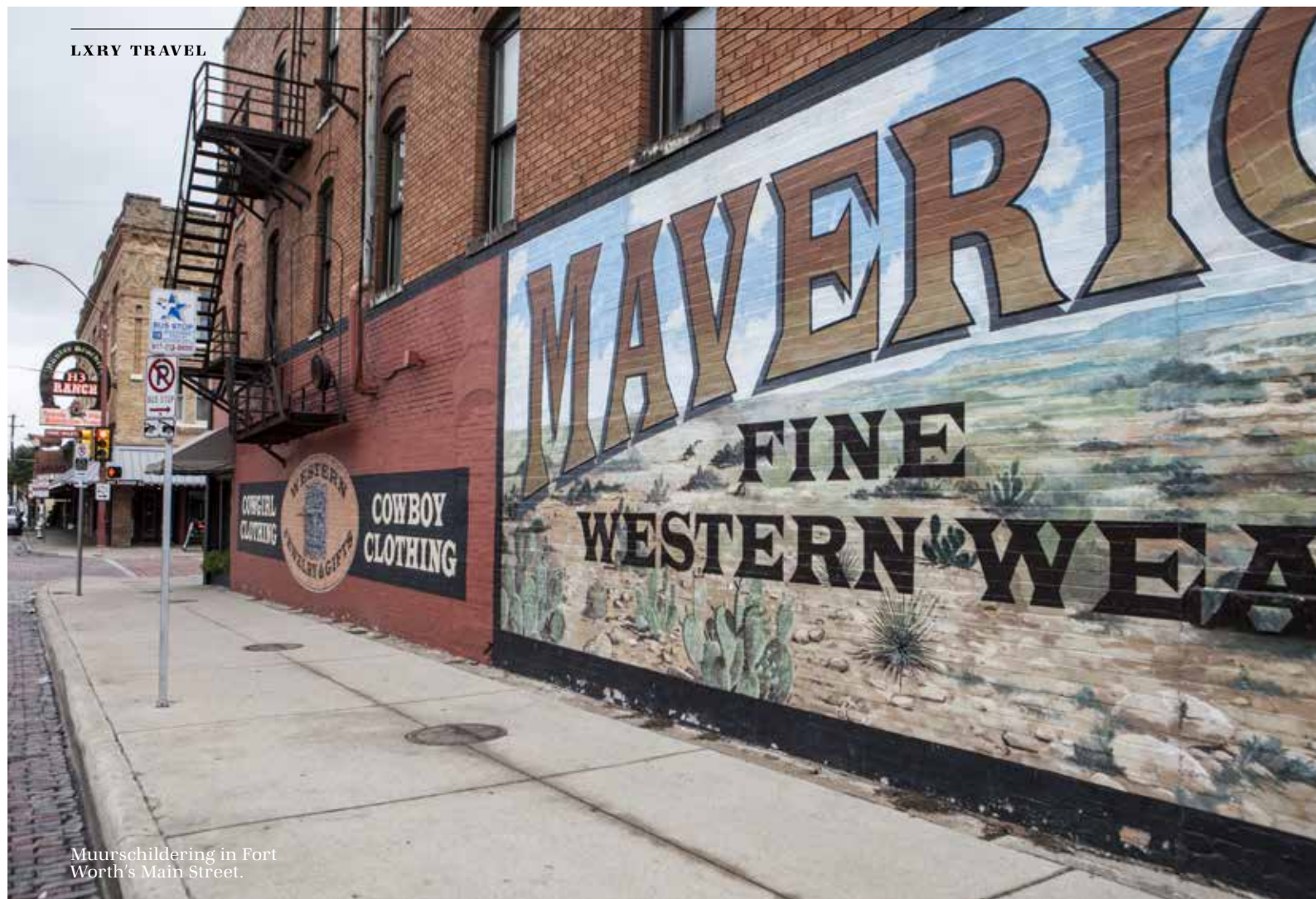
Muurschildering in Fort Worth's Main Street.

Elke ochtend drijven cowboys te paard een kudde Texas Longhorns door de straten van Fort Worth (bijgenaamd Cowtown) om ze te laten grazen in de wei. De dieren hebben extreem brede hoorns en stammen rechtstreeks af van de runderen die de Spaanse kolonisten meebrachten. In vaste formatie trekt de stoet cowboys en vee langs het toegestroomde publiek