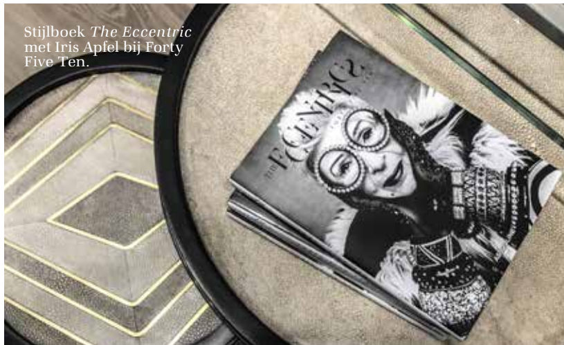
Stijlboek The Eccentric met Iris Apfel bij Forty Five Ten.