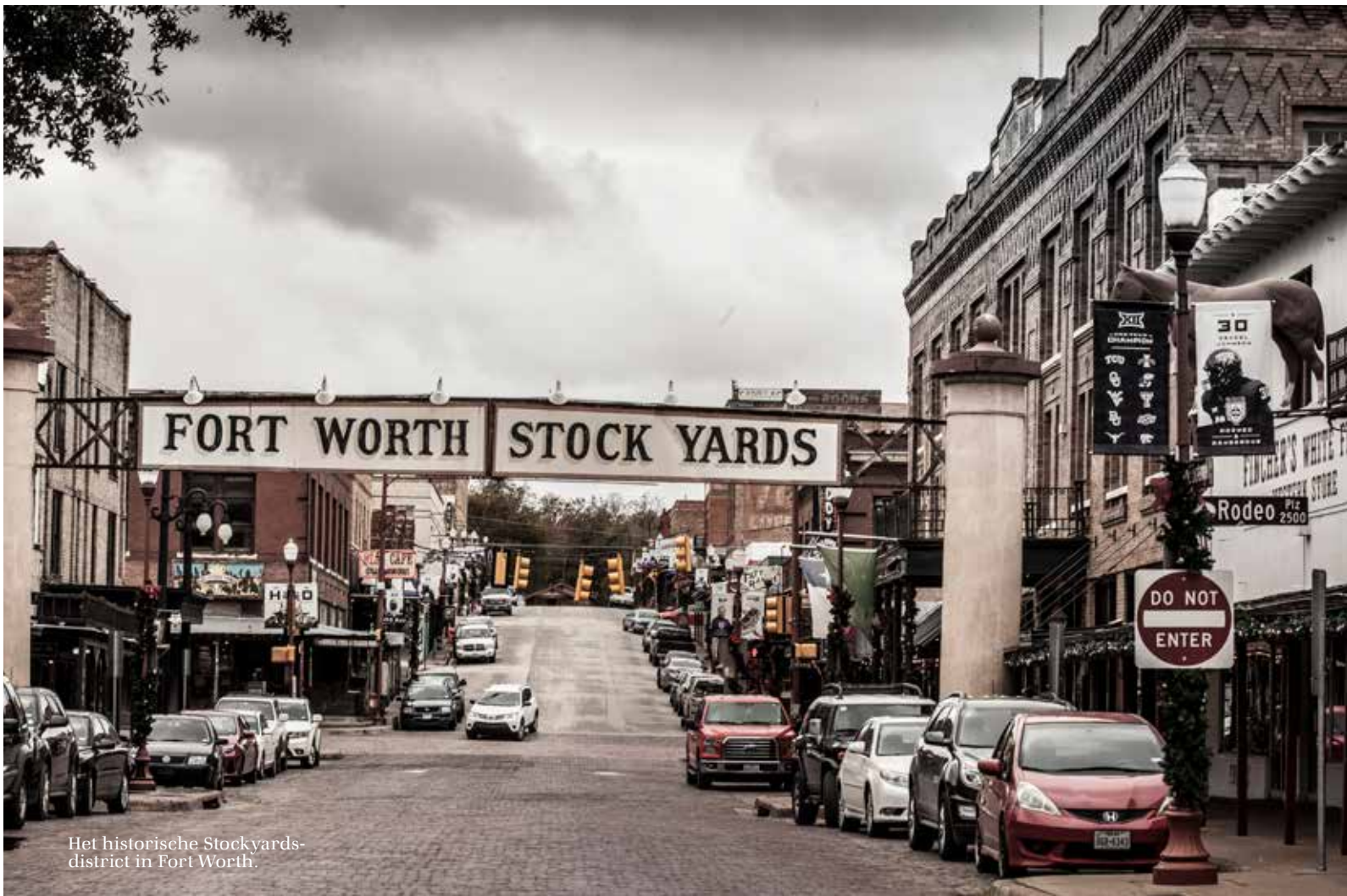
Het historische Stockyards-district in Fort Worth.